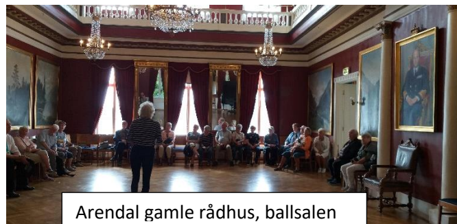
Arendal gamle rådhus, ballsalen

28 deltakere satte seg forventningsfulle i Team Tours buss «Kongen» til nye opplevelser. Det ble besøk til Risør, Lyngør, Tvedestrand, Arendal og Tromøya. Turen ble avsluttet med Kragerø og Jomfruland. Flinker guider gjorde byvandring og besøk opplevelsesrike.